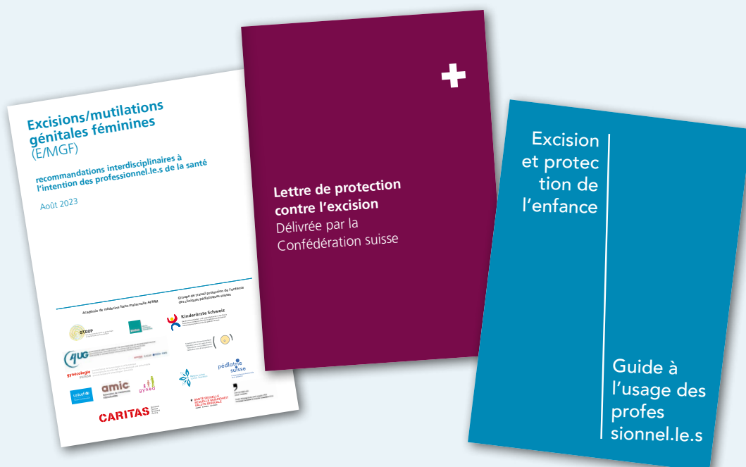
Documentation de référence sur l'E/MGF

Pour plus d'informations et pour suivre les derniers événements, consultez la plateforme www.excision.ch . Ce site web a été développé en 2016 en collaboration avec des représentations de différentes communautés issues de la migration; il est mis à jour régulièrement et propose des contenus destinés aux professionnel·les et aux communautés en sept langues.